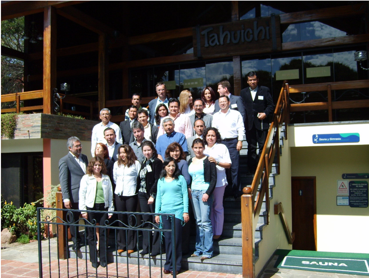
Curso Mapeo de Proceso, Santa Cruz, Bolivia

Estará disponible personal técnico y administrativo de Fundación IDEA en su Oficina Central en La Paz y Oficina Regional en Santa Cruz.