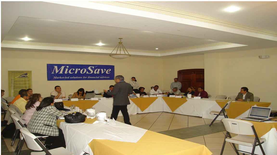
Cursos mapeo de Proceso y Manejo de Riesgo, San Salvador, El Salvador

El curso tiene una duración de tres días y medio , con un contenido muy práctico, estructurado alrededor del caso que forma el hilo conductor del curso y fue desarrollado específicamente con base en las aplicaciones de la herramienta en la realidad Latino Americana, y las introducciones temáticas paso por paso y Sesión por Sesión.