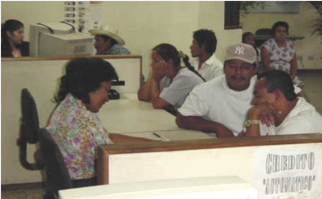
Agilidad, crédito automático, poca paga, inseguridad, riesgo